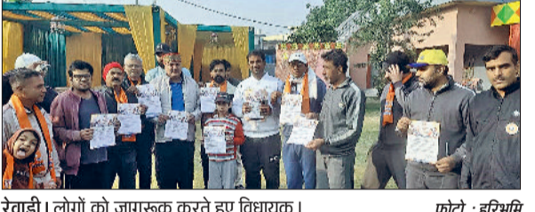
रेवाड़ी। लोगों को जागरूक करते हुए विधायक।