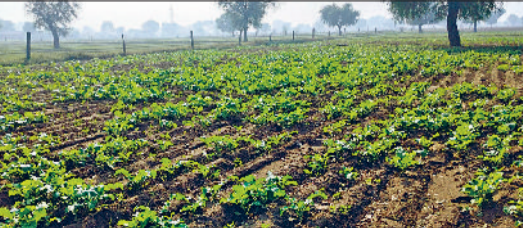
रेवाड़ी। एक खेत में तेजी से बढ़ रही सरसों की पैदावार।

चलते ठंड का असर गायब रहता है। सोमवार से तापमान में गिरावट आने से दिन के समय भी ठंड का असर बढ़ेगा, जिससे लोगों को गर्म कपड़ों की दरकार होगी। मौसम विभाग के अनुसार दिन और रात के तापमान में एक से दो डिग्री तक की