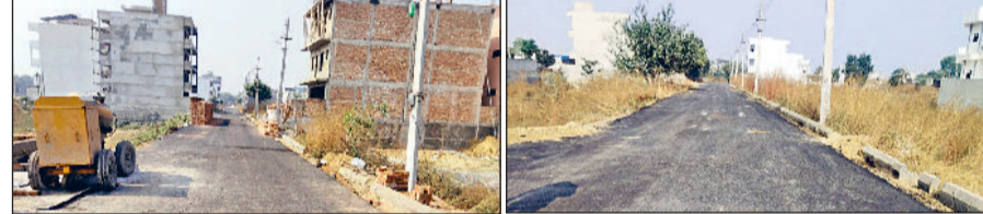
रेवाड़ी। सेक्टर-19 में हाल ही बनी सड़कों से बाहर निकली हुई रोड़ियां।

हरियाणा शहरी विकास प्राधिकरण की ओर से सेक्टर-19 में सड़क निर्माण का जो कार्य शुरू कराया है, उसमें निर्माण सामग्री की गुणवत्ता को लेकर सवाल उठने लगे हैं। निर्माण के साथ ही सड़क की रोड़ियां बाहर आने लगी हैं, जिससे यह सड़क निर्माण के कुछ समय बाद ही दम तोड़ सकती हैं। एचएसवीपी के अधिकारी निर्माण सामग्री की गुणवत्ता पर ध्यान नहीं दे रहे, जिससे सड़क निर्माण में घोटाले की बू आ रही है। सेक्टर-19 इस समय विकसित हो रहा है। इसमें मकानों के निर्माण का कार्य