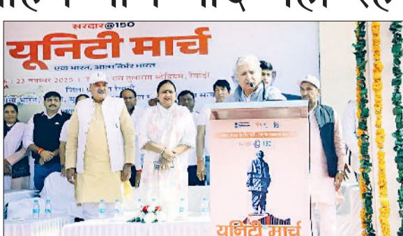
रेवाड़ी। कार्यक्रम में लोगों को संबोधित करते राव इंद्रजीत सिंह।