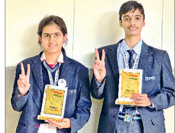
महेंद्रगढ़। विजय चिन्ह बनाकर खुशी जाहिर करते विद्यार्थी।