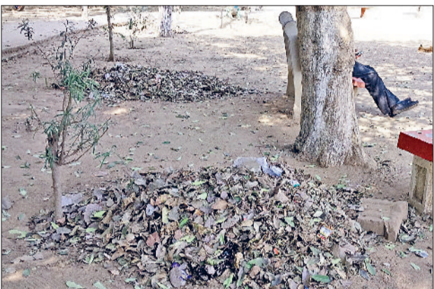
रेवाड़ी। नेहरू पार्क में लगा कचरे का ढेर।

शहर के पार्कों की मटेनेंस के लिए नगर परिषद में प्रति वर्ष लाखों रुपये को बजट आने के बाद भी इनकी दशा बिगड़ी हुई है। नगर परिषद की ओर से पार्कों की देखरेख तक नहीं की जा रही है। शहर के मुख्य पार्कों की दयनीय हालत घूमने आने वाले लोगों की सेहत खराब कर रही है। पार्कों में लाखों रुपये की लागत से लगाए गए ओपन जिम इंस्ट्रूमेंट व झूले टूटकर बिखर चुके हैं। यहां तक कि कई जिम मशीनों के पार्ट्स तक गायब हो गए हैं। पार्कों में सफाई पर बिल्कुल ध्यान नहीं दिया जा रहा है। शहर के राव तुलाराम पार्क, नेताजी सुभाष चंद्र बोस पार्क, नेहरू पार्क व ब्रास मार्केट के पार्क में जगह-जगह गंदगी के ढेर लगे हुए हैं।