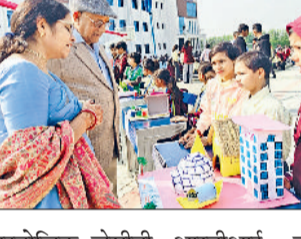
रेवाड़ी। प्रदर्शनी में अपने मॉडलों की जानकारी देते विद्यार्थी।

रविवार को वीआईपी स्कूल में विज्ञान, सामाजिक विज्ञान, अंग्रेजी व हिंदी सहित विभिन्न विषयों पर आधारित प्रदर्शनी का आयोजन किया गया। विद्यार्थियों ने चंद्रयान, संसद भवन व जेसीबी मशीन सहित अनेक नवाचारी एवं आकर्षक मॉडलों का प्रदर्शन किया। शिक्षकों व अभिभावकों ने प्रत्येक मॉडल का अवलोकन कर बच्चों की मेहनत की सराहना की। विद्यार्थियों ने जल चक्र, मानव हृदय का मॉडल, ज्वालामुखी विस्फोट, सौर ऊर्जा मॉडल,