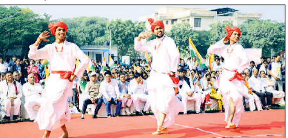
रेवाड़ी। स्टेडियम में देशभक्ति कार्यक्रम पेश करते कलाकार तथा यूनियटी मार्च में शामिल भाजपा नेता, नागरिक व विद्यार्थी।

केंद्रीय मंत्री ने कार्यक्रम में लोह पुरुष सरदार वल्लभ भाई पटेल के चित्र पर पुष्प अर्पित कर वन्दन किया। कार्यक्रम में विभिन्न शिक्षण संस्थानों के विद्यार्थियों और नागरिकों को एक भारत आत्मनिर्भर भारत के तहत राष्ट्रीय एकता और स्वदेशी अपनाने की शपथ दिलाई गई। केंद्रीय मंत्री राव इंद्रजीत सिंह ने पदयात्रा को हरी झंडी दिखाकर रवाना किया। राव तुलाराम स्टेडियम से शहर के विभिन्न चौक से होती हुई यह पदयात्रा लघु सचिवालय के समीप स्थित शहीद स्मारक पर संपन्न हुई।