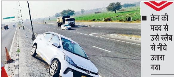
रेवाड़ी। डिवाइडर के पास बने स्लैब पर तिरछी खड़ी कार।

जैसलमेर हाइवे से दिल्ली-जयपुर नेशनल हाइवे को जोड़ने वाले आउटर बाईपास पर रविवार सुबह उस समय बड़ा हादसा होने से टल गया, जब टायर फटने के बाद डिवाइडर के स्लैब पर चढ़ गई। कार में सवार चालक व अन्य लोग बाल-बाल बच गए। आउटर बाईपास एक स्विफ्ट कार जैसलमेर रोड की ओर जा रही थी। जब कार फर्लाइओवर से नीचे उतर रही थी, तो उसका अगला टायर फट गया। स्पीड तेज होने के कारण कार डिवाइडर के साथ बनाए गए लगभग पांच फुट ऊंचे स्लैब पर चढ़ गई।