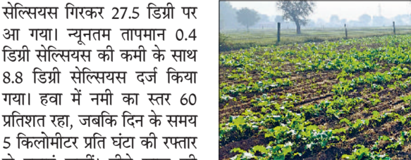
रेवाड़ी। एक खेत में तेजी से बढ़ रही सरसों की पैदावार।

नवंबर माह के अंत में ठंड के तेवर तीखे होने शुरू हो गए हैं। दिन-रात के तापमान में गिरावट आना शुरू हो गया है। इस सप्ताह तापमान में और गिरावट आ सकती है, जिससे लोगों को माह के अंत में कड़ाके की ठंड का सामना करना पड़ेगा। सुबह के समय प्रदूषण का संकट अभी भी लोगों को परेशान कर रहा है। जल्द बारिश के अभी कोई आसार नजर नहीं आ रहे हैं। रविवार को सुबह से ही आसमान साफ रहा। प्रदूषण के चलते धुआं कोहरे की तरह छाया रहा। अधिकतम तापमान 0.5 डिग्री